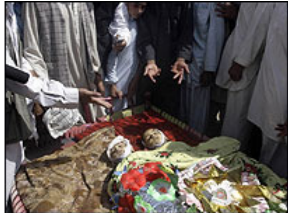
تصویر ۳ : کودکان بخون خفته هود خیل کابل که در اثر بمباران قوای امریکا و ناتو کشته شده اند. تصویر : از بی بی سی مؤرخ اول سپتمبر ۲۰۰۸