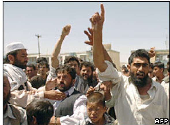
تصویر ۵ : اعتراض مردم در جلال آباد بر ضد قوای ناتو و امریکا که موجب تلفات ملکی گردیده اند.