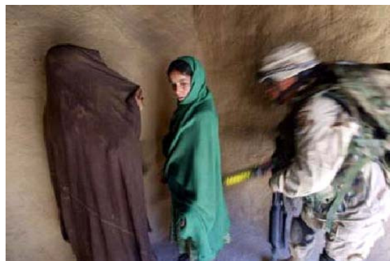
تصویر ۸ : تجاوز عساکر اجنبی به خانه و خانواده افغانها.