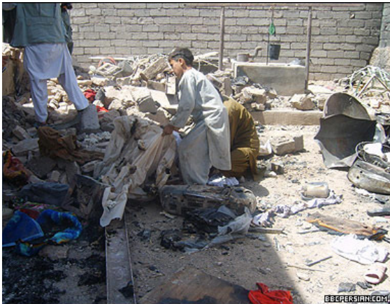
تصویر ۶ : بمباران وحشیانه امریکا در عزیز آباد شیندند که در آن حدود ۱۰۰ نفر کشته و حدود ۵۰ نفر به شدت زخمی شدند.