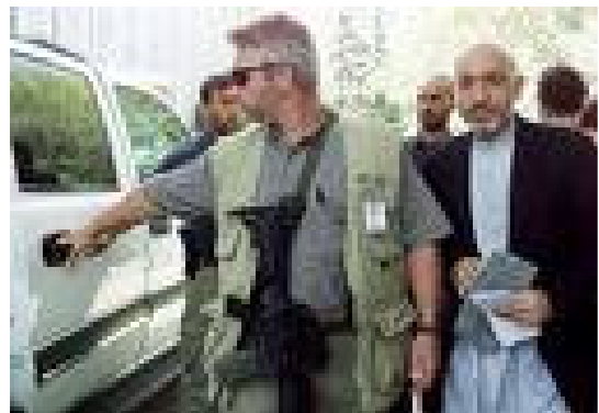
تصویر ۱ : حامد کرزی تحت محافظت نظامیان امریکایی.