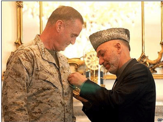
تصویر ۴ : حامد کرزی در حال آویختن مدال بر سینه یکی از صاحب منصبان امریکایی.

تصمیم گرفته که حامد کرزی و دم و دستگاه او را که تاریخ مصرف شان سپری شده است، به زیاده دانی تاریخ می سپارد.