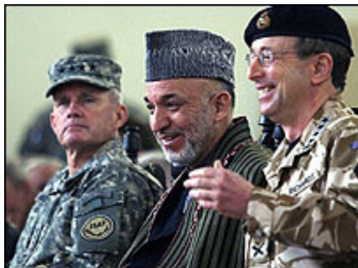
تصویر ۲ : حامد کرزی تحت حمایت صاحبمنصبان امریکایی.

در دوره حامد کرزی : اماکنی که حامد کرزی در آن اقامت دارد، توسط عساکر امریکایی محافظت میشوند و محافظین شخص حامد کرزی نیز امریکاییها اند (تصاویر ۱ و ۲). چنانکه حامد کرزی در سپتمبر سال ۲۰۰۲ طی سفر خود به قندهار که زادگاه اوست، مورد حمله تروریستی یک همشهری اش قرار گرفت. امریکاییها حمله کننده را کشتند و حامد کرزی را از خشم ملت خودش نجات دادند. این چه شرم عظیمیست که حامد کرزی از قهر مردم خویش در آغوش بیگانه پناه میجوید. بر خلاف شاه شجاع، حامد کرزی از چشم انداز عساکر امریکایی دور تر نمیرود و وجود آنها را در ارگ و خانه اش منافی حیثیت و وقار خود و کشور خود نمیداند (تصاویر ۱ و ۲).